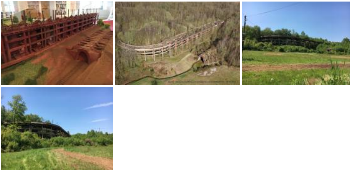
Model im Maison de Fer — Luftbild - heute

In der Nähe der Mine befinden sich Bocagerie-Öfen (Röstöfen) die das Erz für die Hochöfen im Nordfrankreich vorbereiteten. Durch die Röstung wurden Nichteisenverbindungen, Schwefel und Wasser dem Erz entzogen. Dadurch verlor das Erz etwa 20% seines Gewichts, was die Transportkosten beträchtlich reduzierte. Das Eisencarbonat (40% Fe) wurde in Eisenoxid (50 % Fe) umgewandelt. Bis heute ist die Stahlkonstruktion erhalten geblieben.